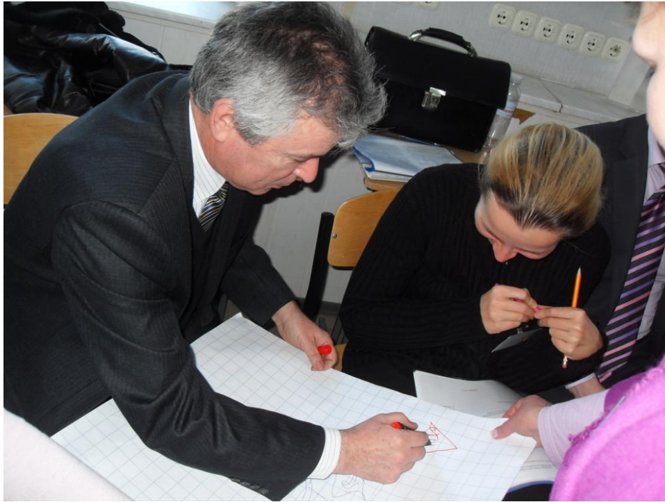
Думка кожного почута та врахована...