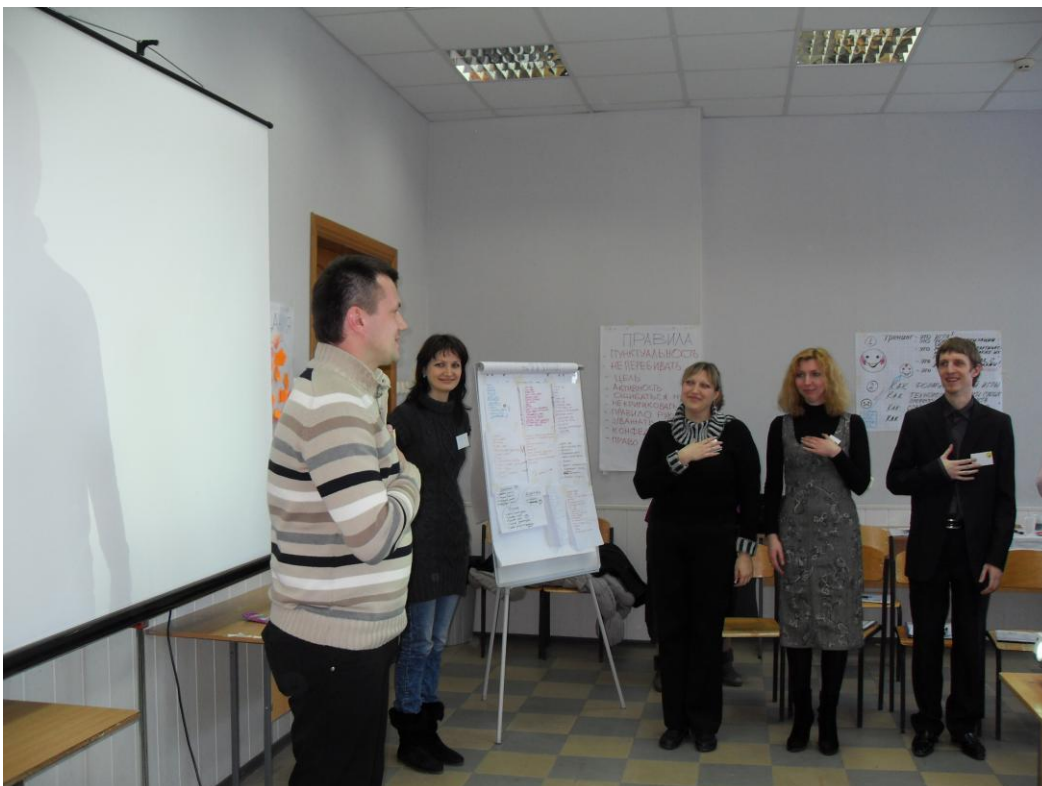
Презентація групової роботи – професійно і з душею...