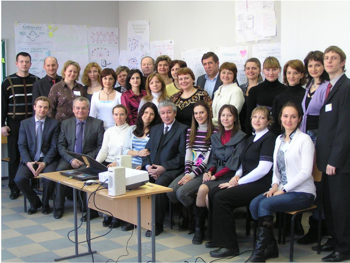
Нове покоління викладачів-тренерів