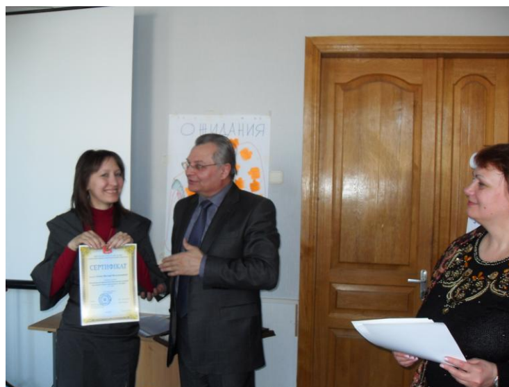
Сертифікація учасників тренінгу