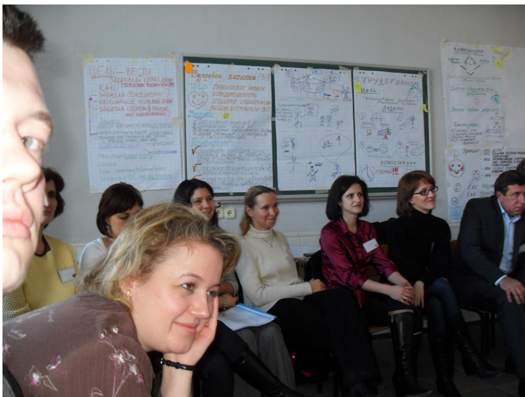
Магія тренінгового кола