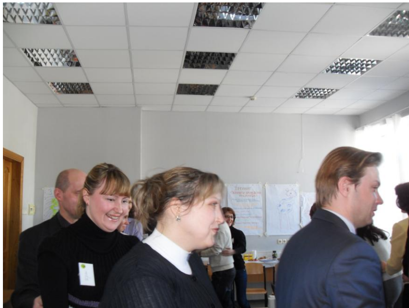
Рухавка «Пошта їде»