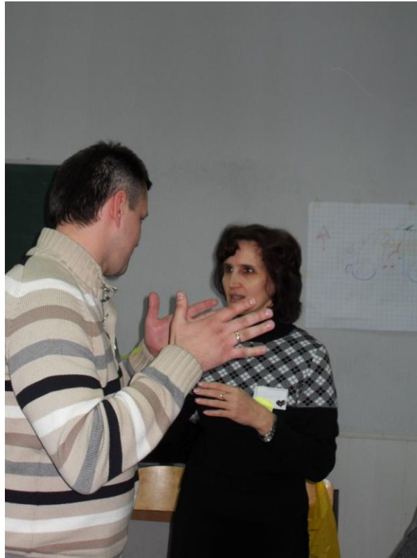
Дискусія – королева тренінгу