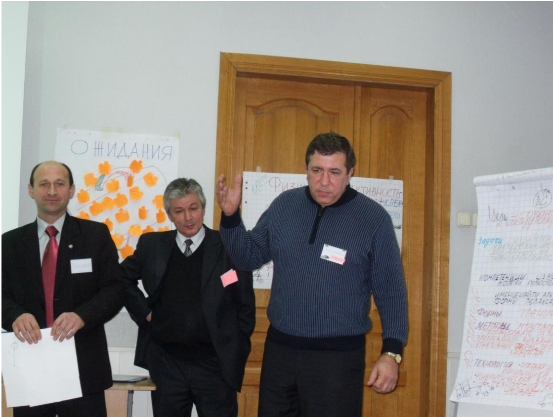
Досвід, кмітливість, енергійність – запорука успіху викладачів-тренерів.