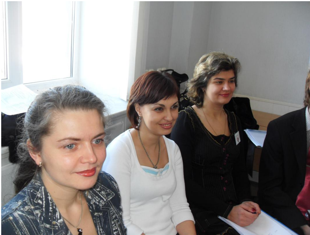
Чарівність, компетентність та успішність