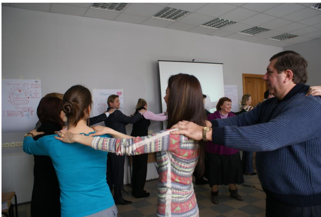
Рух – це життя!