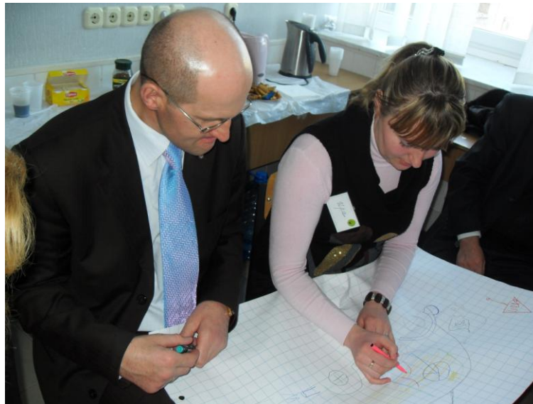
«Коллективна робота «Автомобіль» - разом легше будувати... ;))