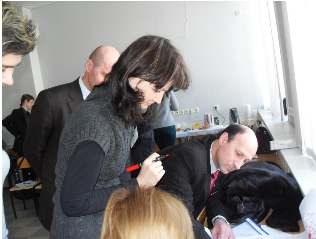
Робота в групах . Жодної хвилини не витрачено даремно!